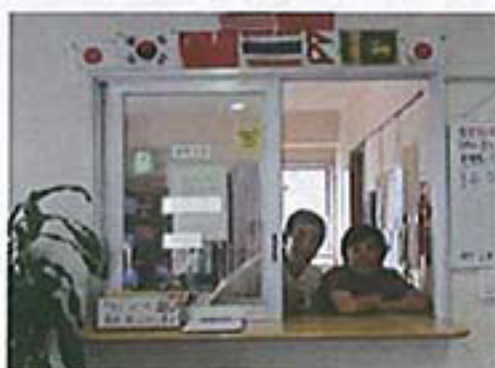
定期清掃（イメージ）