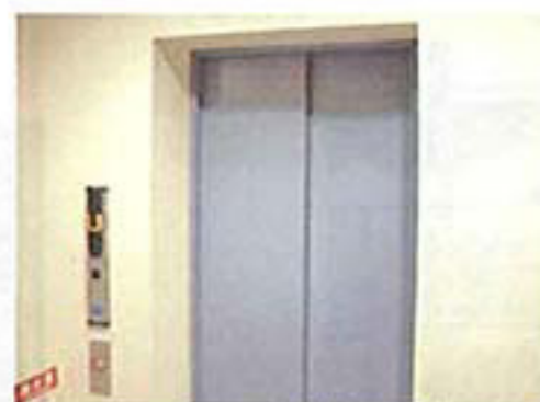
エレベーター（男性用）