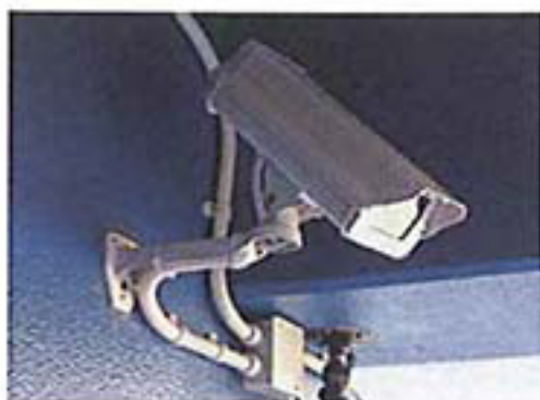
セキュリティーカメラ