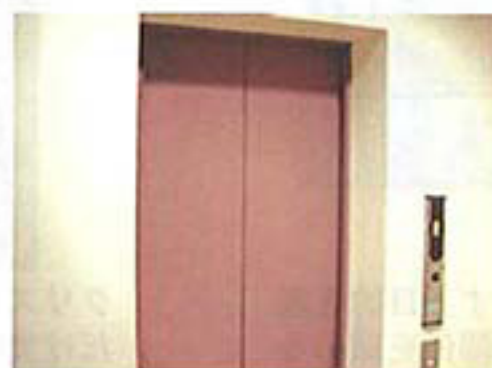
エレベーター（女性用）